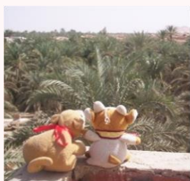
(シーワオアシスのヤシ畑。 2010年撮影)